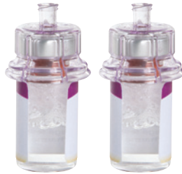
1 oder 2 Durchstechflaschen mit rekonstituiertem Cinryze