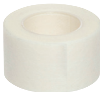
Medizinisches Klebeband (nicht in der Packung enthalten)