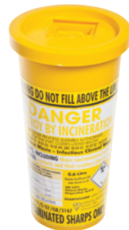
Abfallbehälter für spitze Gegenstände (nicht in der Packung enthalten)