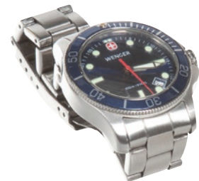
Uhr (nicht in der Packung enthalten)