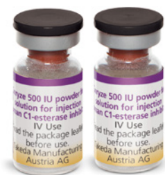
1 oder 2 Cinryze-Durchstechflaschen (Pulver, jeweils 500 I.E.)