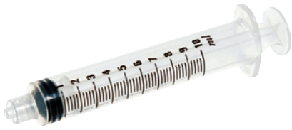
1 10-ml-Einwegspritze mit Luer-Lock