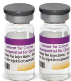
1 oder 2 Durchstechflaschen mit Wasser für Injektionszwecke, (Lösungsmittel, jeweils 5 ml)