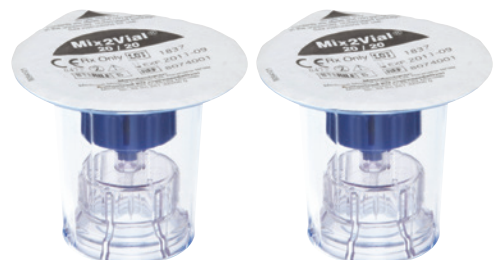
1 oder 2 Filter-Transfersets