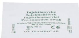
2 Desinfektionstupfer (nicht in der Packung enthalten)