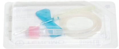
1 Venenpunkionsbesteck (Butterfly-Kanüle mit Schlauch)